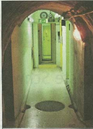
Nur MitarbeiterInnen, das Wachpersonal und vereinzelt geladene Kundschaft wissen, was im Innern des Bergmassivs vor sich geht.

Kundendaten, Strategiepapiere, Personaldossiers und vieles mehr: Privatnutzer und Firmen vom KMU bis zum internationalen Grossunternehmen speichern solche Informationen heute auf digitalen Datenträgern. Was praktisch ist, bietet jedoch nur eine äusserst beschränkte Sicherheit. Computerprobleme, Diebstahl oder Naturgewalten können zum kompletten Verlust aller digitalen Ressourcen führen. Hunderte von Arbeitsstunden oder eine vollständige Firmenstruktur sind dabei gefährdet. Dieses Risiko lässt sich mit professioneller Datensicherung gezielt vermeiden. Datenbestände ändern sich manchmal täglich. Ein Abspeichern auf selbst erworbenen externen Datenträgern ist weder dauerhaft zuverlässig noch praktisch: Die günstige Technik kann versagen, die schnelle Wiederherstellung einzelner Dateien ist aufwändig oder unmöglich. Der Unterhalt einer lokalen Backup-Struktur stellt