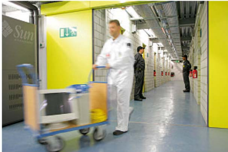
Seit 1994 unterhält der Mutterkonzern SIAG zwei Rechenzentren im Berg.

Schweizer Armeefestungen, tief im Berg. Ob Unwetter, Erdbeben oder elektromagnetische Strahlung; diese geheimen und völlig autarken Konstruktionen sind dagegen resistent. Der Personenzutritt erfolgt sehr restriktiv und wird durch einen 24-Stunden-Betrieb konstant überwacht.